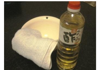
酢のパワーでピカピカに・・・

そして畳の雑巾がけは、から拭きが基本なんです。どうしても汚れが目立つときは、水拭きも行って下さい。水拭きのポイントは酢を利用すること。雑巾に水10:酢1の割合