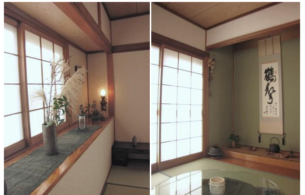
(左)壁紙を変え、新和風に生まれ変わった和室出窓。(右)床の間の壁だけはうぐいす色に…。

このリフォームでは和室の壁の色も変更。以前はじゅらく調の壁紙で少し暗い雰囲気のとこと。壁紙を変え、明るく少しモダンな新和風の和室に変わりました。その要因は、残念ながらこの写真ではお伝え出来ませんが、奥様の選ばれたクロスの柄と床の間の色。「今までは、LDKで日中を過ごすことが多かったけど、最近は和室にいることも多くなりました」と、嬉しいお言葉。