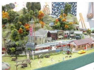
日生ニュータウンの街並みの鉄道模型。

11月の初め、サピエのギャラリーで開催された『手味人展』に行ってきました。地元の有志の会で、色々な手作りの力作が勢揃い！主催者は「今まで個人で発表する場がなかったの、今回初めての作品展です。地域のコミニティーの場となり、参加者が増え、次回も開催できたらと思っています。」と話して下さいました。物作りの素晴らしさと、地域愛がいっぱい詰まった作品展でした。(尼崎)