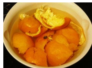
ミカンでツヤ出しが可能。

ミカンの皮を5個程度用意し、水に浸し、電子レンジで10分程度ほどチンします。水がオレンジ色になりますので、ミカンを取り出し、バケツに移し、雑巾を浸して固く絞り、畳の目に沿って拭いていきます。ミカンの皮に含まれるフラボン配糖体と呼ばれる精油成分が、畳の表面に艶を出してくれます。（高橋）