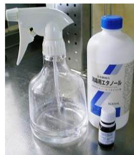
カビには消毒用エタノール。ユーカリオイル(手前)を混ぜればダニにも有効。

でまぜた酢水をしみこませ、固く絞って拭けば、簡単にキレイに。また、酢を使わないのであれば、水は避け、なるべくお湯を使うことです。お湯の方が汚れが取れ、乾燥が早くなります。