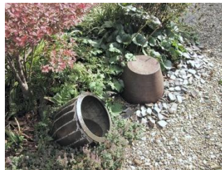
陶器やその破片を組み合わせ奥様が造られた庭の一部。

お庭の一部は、なんと材料の調達から工事までご自身で造られたとのこと。造園屋さんのお仕事と区別がつかない程の出来栄えなのです。