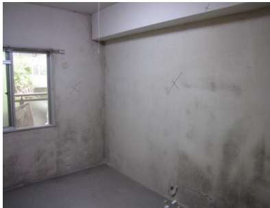
結露で発生したと思われる「黒カビ」

昨シーズンから当社で検討をしているマンションの「結露・カビ対策」。とくにこれからのシーズンはその発生で悩まれるケースが多くなります。