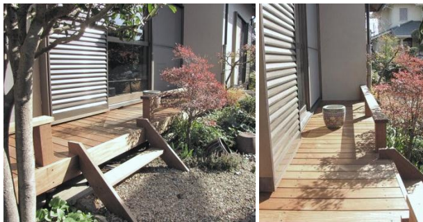
素材にこだわり新たに設置したウッドデッキ。

な物をと、素材や寸法にこだわりました。デッキ材にはイペ材を採用。イペ材は強度があり、反りや割れなどが少ない耐候性のあるウッドデッキに適した自然素材。最近では、樹脂を混ぜた工業製品もあり、メンテナン