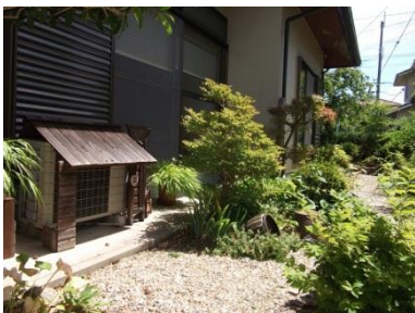
以前のリビング前の風景。

丁寧にお庭を造っていくと、しだいにコンクリート土間テラスの味気無さが気になり、今回ウッドデッキの設置を検討。