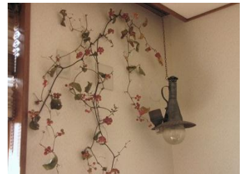
エアコンのコンセント跡は、近くの山の木でかわいく目隠し。

また、ウッドデッキの設置に伴いエアコンの位置を変更。配管跡が残りましたが、そこは奥様のセンスの良さでカバー。赤い実の付いた木で可愛らしく壁面アート。