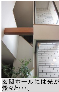
玄関ホールには光が燦々と・・・。

このお住まいは20年あまり前に建てられた注文住宅。その当時のこだわりが今でも感じられ、今なお斬新な雰囲気の