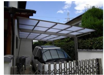
すっきりとしたデザインに変更。

そこで、お客様が来られた時、最初に目に入る外部を中心にリフォームすることに。外壁の塗り替えを行うと共に、根元から腐って倒れかかっていたガーデンライトの