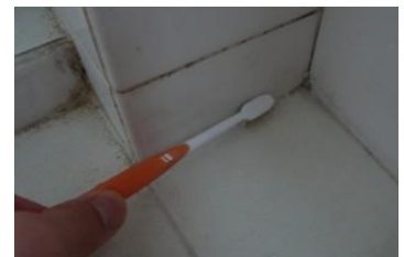
粉っぽい感じが消えるまで混ぜる

ペースト状になった重曹を歯ブラシにとってゴシゴシするだけ。タイル目地の黒い汚れも白く綺麗になります。ポイント