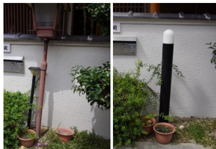
(左)倒れかかった旧ガーデンライト (右)新たに設置したガーデンライト

えました。「やるなら今しかない」と、様々な所をリフォームしましたが、本当に思い切った良かった」と、感想を伺いました。