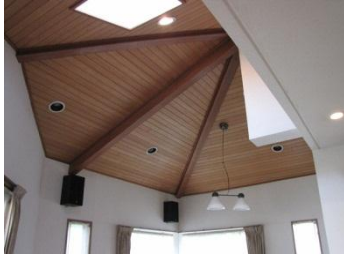
ダイニングの天井は高く、扇型。

今月はお嬢様のご婚約を機にリフォームをされた方のリフォームを2件ご紹介させていただきます。