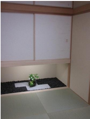
押入が吊り押入と床(とこ)に変わりました。

以前の和室には床の間がなく、1間の押入れがあるのみ。お嬢様のご婚約を機に和室を改装することに。この機会に以前からの『和室が殺風景なので、お花などをちょっと飾れるような床の間を造れないかなあ・・・』という想いをご相談いただきました。