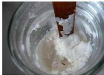
粉っぽい感じが消えるまで混ぜる

市販の洗剤を利用するのもいいですが、環境にやさしく作業環境も良好な「重曹」をおすすめします。しかも浴室の汚れでしたら水を加えるだけで予想以上に汚れが取れます。用意するものは密閉できる空き瓶。この容器の中に重曹を適量いれて、水を少しづつ入れながらかき混ぜるだけ。ソフトクリームよりチョット固めになれば OK。これなら、作り置きしても乾燥しなくていいですよ。