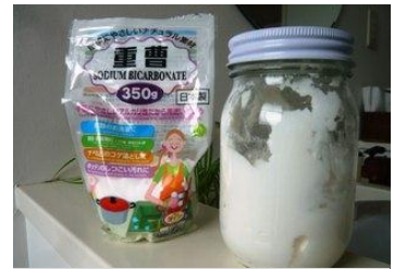
重曹は百元ショップで手軽に入手

浴室の壁、天井、ドアや水栓回りなど、カビの発生で汚れるケースが多いですね。この原因は適度な温度と水分。窓を開けて通気をよくする