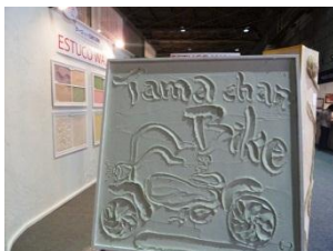
ヨーロッパ製天然素材の壁材

や“光る椅子”の新作発表がありました。「人と環境に優しいエコ」をテーマにした各作品には大変共感しました。例えば段ボール製の最新技術のロボットを展示会の簡易受付に活用したり、住む人に温もりと安らぎを与える木材で和室を作り「和のこころ」を伝える等々…。面白いアイデア満載で、とても参考になった1日でした。(尼崎)