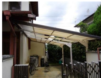
以前のカーポートの屋根。

えをご依頼いただきました。が、お話ししていく中で、お嬢様のご結婚も決まったこともあり、せっかく一部を綺麗にするなら、他の気になる部分もと・・・。