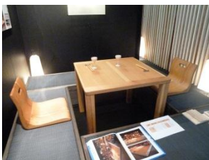
リビングに即変身「置き和室」(左)。組立て式移動和室(右)。