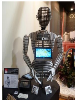
段ボール製広告メディアロボット。

これからの「素敵な暮らし」を提案する展示会『LIVIG & DESIGN』に今年も行ってきました。イタリア、フランス、中国等海外からは、LED照明