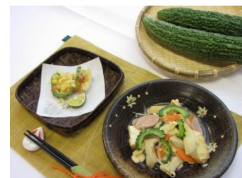
ゴーヤのかき揚げとチャンプルー。お味はどちらもサイコーでした♪

どちらもゴーヤの苦みがほどよく楽しめる美味しかったです。また、実演はなかったのですが先生からご紹介があった「 ゴーヤジュース 」。美味しそうですね♪。すりおろしたゴーヤをオレンジジュースと合わせていただきます。“手”でゴーヤをすりおろすのがポイント。ミキサーですとゴーヤのビタミンCが壊れてしまうそうです。またオレンジジュースに含まれる“クエン酸”がビタミンの破壊を抑えるとの事。簡単・手軽にできますので皆さまもチャレンジされてはいかがでしょう？(濱崎)