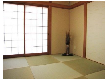
縁なし畳が、より一層現代的な和室を印象付けてくれます。