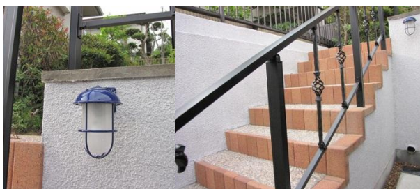
(左) 青い傘が印象的なランプのような照明。(右) 洗い出し煉瓦で造られた階段とロートアイアン風の手摺。

新しく出来上がったアプローチには、階段に使われている煉瓦をはじめ、ランプ風の照明やロートアイアン風の手摺といった柔らかい印象のものを採用。明るくなった雰囲気にもF様はご満足の様子でした。駐輪スペースも確保され、近くにお住いの娘さんやお孫さんが今まで以上にどんどん来られることになれば、うれしいですね。(森野)