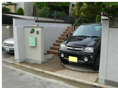
新しい門廻りには、駐車場も。

新しく出来上がったアプローチには、階段に使われている煉瓦をはじめ、ランプ風の照明やロートアイアン風の手摺といった柔らかい印象のものを採用。明るくなった雰囲気にもF様はご満足の様子でした。駐輪スペースも確保され、近くにお住いの娘さんやお孫さんが今まで以上にどんどん来られることになれば、うれしいですね。(森野)