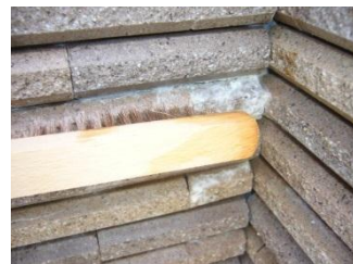
トイレ用洗剤でゴシゴシ。

まずはブラシにトイレ用洗剤をつけ、白華部分にこすり付けます。すると、シュワシュワと泡が出てきます。数分置き、スポンジでふき取って下さい。