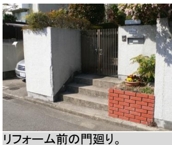
リフォーム前の門廻り。

スペースしかなく、自転車の駐輪場所にも困られていました。当初はこの日生ニュータウン内にお住いの娘さんたちが来られた時の駐輪スペースをということでしたが、門廻りや花壇などを解体していくと、予定以上のスペースを簡単に解体できることが判り、駐車場を設けることに。これまで近所にある貸し駐車場に止められていたそうです。「近くではあったけれども、断然便利になりました」とのこと。