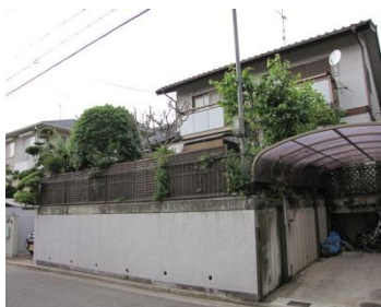
敷地の南東にある既存駐車場。 玄関は西側に。