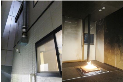
火災実験棟にて、本物の家を使いリアルに火災実験を実施。(右)は着火火災実験の様様。

電波などに連動し鳴動するタイプ)、単独型(煙を感知した警報器のみが鳴動)の2つの火災警報器を比較するといったもの。火災は1Fで起こり、我々は2Fで待機。連動型は1Fの火災時とほぼ同時に2Fの警報器から「他の部屋で火事です！」と教えてくれるので、