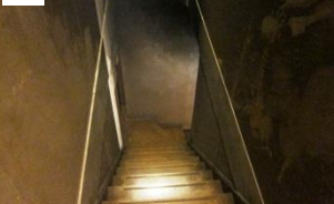
階段から煙が上へ。2Fから1Fの警報音は聞こえるがやや遠い印象。