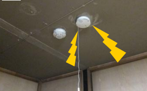
2Fの連動型は1Fと同時に鳴動。単独型が鳴ったのはその7分後。

すぐ非難が可能。しかし、単独型は2Fまで煙が充満しないと2Fの警報器は鳴りません。1Fの警報器自体も大きな音が鳴りますが、遮音効果の高い最近の家では聞こえない可能性も高いです。7分後2Fの警報器が鳴動した段階で1Fに降りてみましたが、1Fは煙が充満し、とても逃げられる状態ではありませんでした。煙の恐怖を体感し、その7分の差の大きさを実感。その差は歴然。今から設置を検討される方は絶対に連動型を選択して頂きたいですね。(高橋)