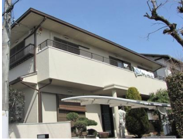
外壁も再塗装して、美しい外観に。

今回は前回増築した部分の使い勝手の改善を当社にご相談いただきました。構造的に必要な既存壁を活かしながら、間取りを変更することに。お部屋の使い方にあった広さを確保すると共に、心地よく暮らせるよう工夫いたしました。