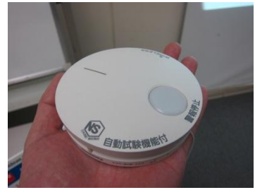
おススメは断然、「連動型」!

すぐ非難が可能。しかし、単独型は2Fまで煙が充満しないと2Fの警報器は鳴りません。1Fの警報器自体も大きな音が鳴りますが、遮音効果の高い最近の家では聞こえない可能性も高いです。7分後2Fの警報器が鳴動した段階で1Fに降りてみましたが、1Fは煙が充満し、とても逃げられる状態ではありませんでした。煙の恐怖を体感し、その7分の差の大きさを実感。その差は歴然。今から設置を検討される方は絶対に連動型を選択して頂きたいですね。(高橋)