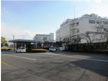
パナソニック電工本社。

門真にあるパナソニック電工さん本社で実施された住宅用火災警報器実験に参加してきました。