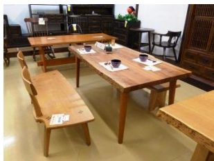
風情な高山の町並み(左)。木の温もりのある飛騨家具(右)。