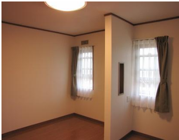
中央の壁は耐震壁のため残したが、開口を設け圧迫感を解消。

今回は前回増築した部分の使い勝手の改善を当社にご相談いただきました。構造的に必要な既存壁を活かしながら、間取りを変更することに。お部屋の使い方にあった広さを確保すると共に、心地よく暮らせるよう工夫いたしました。