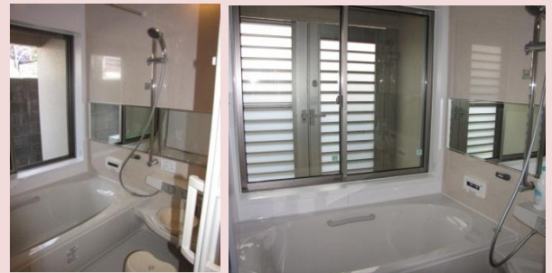
新たに入れ替えられたシステムバス(左)。坪庭に面した大きな透明ガラスの窓と視線を遮る半透明の外部格子で明るく広がり感のある空間に変身(右)。

「窓が開けられないので換気が不十分で困っている」とのことでした。そこで、一部外壁を取り壊し屋外に面するように窓を設けました。そして、窓の外部には、入浴の際、眺められる小さな坪庭をつくりました。この空間は浴室が広く感じられる効果もあり、ご満足な様子。S様は「自分の家ですが、住まいながらの工事は多少疲れますね。でも今回のリフォームでお部屋の使い方がはっきりしたことで、使い勝手がよくなりました。やっぱりリフォームして良かったです。そして工務店の林さんの心配りは本当に素晴らしかった」と、お褒めのお言葉をいただきました。ありがとうございました。(森野)