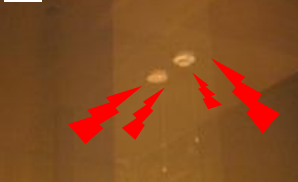
約4分後、1F天井についた警報器が鳴動。連動型・単独型とも作動。