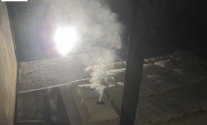
1Fにて煙草火が枕に着火。僅か数分で部屋中に煙が充満...