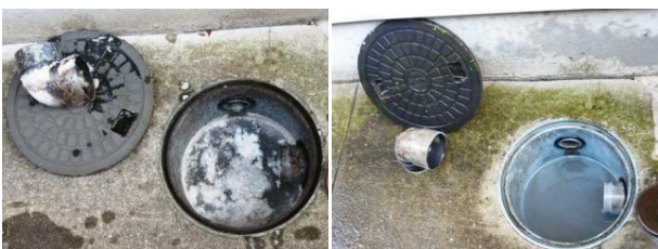
石鹸・油脂分・ヘドロ等の付着で汚れた排水枡(左)高圧洗浄後はこんなに綺麗スッキリに・・・(右)。