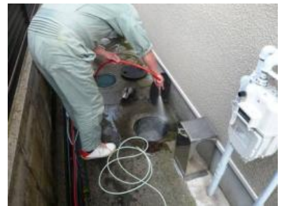
蓋や溝等も丁寧に清掃してくれます。

らの洗浄。中と外は違うホースを使用します。洗浄には水道水を使用するので衛生的にも安心です。キッチンから浴室、洗面化粧台、洗濯排水と順番に洗浄していきます。一階の洗面化粧台から汚物が逆流したのにはさすがの濱崎編集長もビックリ。作業は全体で2時間くらいで終了しました。