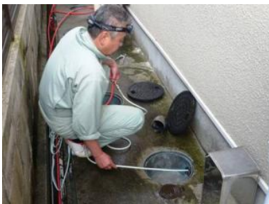
この微妙な調整がまさにプロの技。

し洗浄します。この圧力は通常の水道管の約10倍。まともに手に当たると、皮膚が切れてしまうほどの力があるそうです。特殊ノズルは水が斜め後ろに出ます。