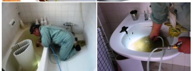
室内を汚さないよう丁寧に作業を進めます。洗面所から汚物が逆流したのにはビックリ。これだけ汚れていたんですね(右下)。