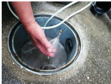
斜め後に噴射する特殊ノズルで洗浄。

作業開始。各排水枡から、建物内部に排水管が設置されていますが、それを特殊ジェットノズルによる高圧水(約50 kg/m 2 )を噴射